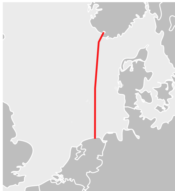
700 MW leiding van Delzijl naar Noorwegen

Van de 100% RES productie komt totaal 59% in het grid.